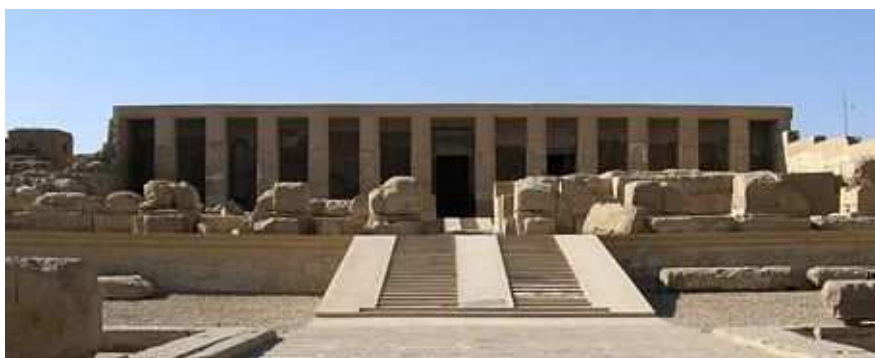
Tempel in Abydos

Het lichaam van Osiris werd gevonden door Isis en hij werd gebalsemd en begraven in Abydos. Da's feitelijk een heel ander verhaal.